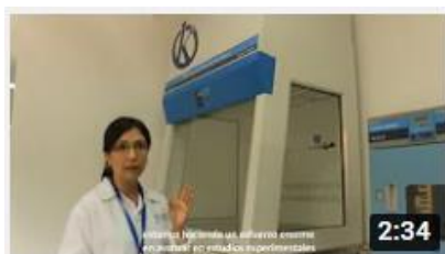
Kalstein France - Jacinto Convit Foundation / Allianc...