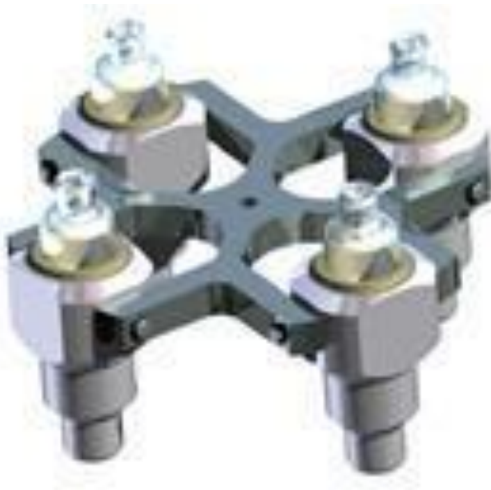
NO.1 Rotor pivotant Vue du rotor adaptateur