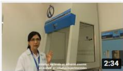
Kalstein France - Jacinto Convit Foundation / Alliances