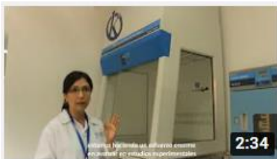
Kalstein France - Jacinto Convit Foundation / Alliances 23 views • 3 years ago