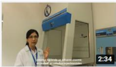
Kalstein France - Jacinto Convit Foundation / Allianc...