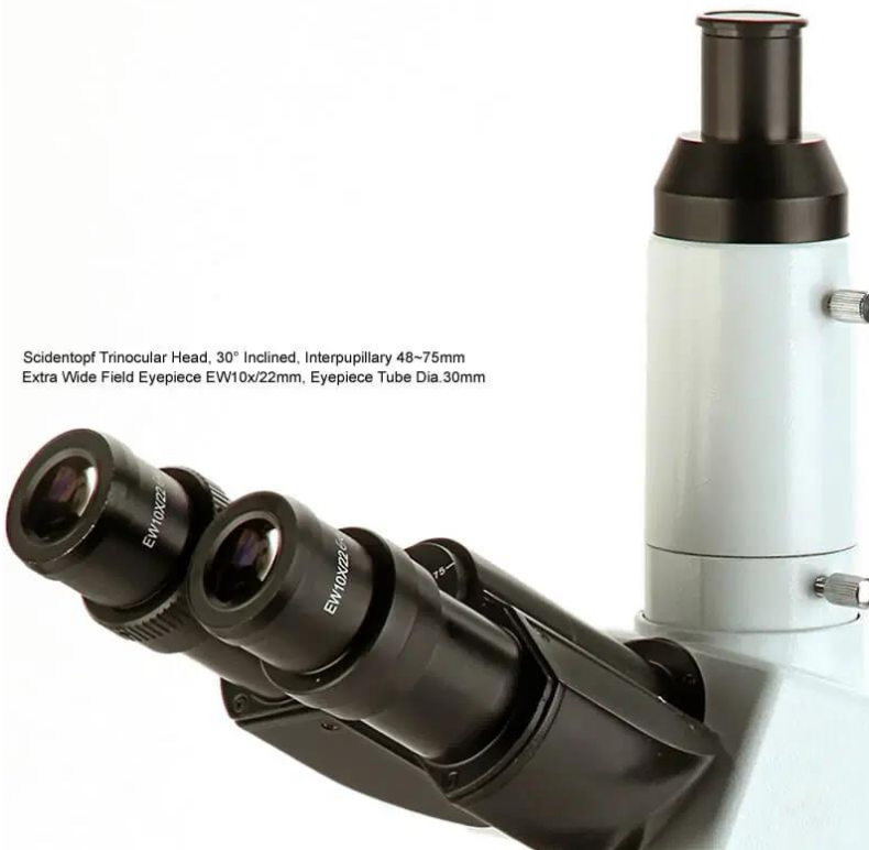
Scidentopf Trinocular Head, 30° Inclined, Interpupillary 48-75mm Extra Wide Field Eyepiece EW10x/22mm, Eyepiece Tube Dia.30mm