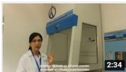
Kalstein France - Jacinto Convit Foundation / Alliances 23 views • 3 years ago

(Canal de YouTube y sitios web oficiales)